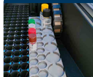
TestLine stojan pro reagenty rack DSX